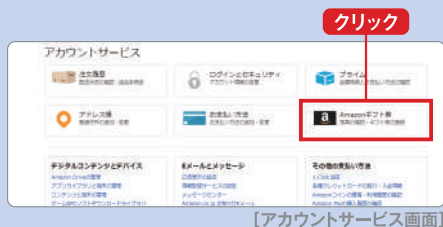
[アカウントサービス画面]

①の方法でAmazonサイトを開いて右上の「こんにちは。ログイン アカウント&リスト」にカーソルを合わせ「アカウントサービス」をクリック。アカウントサービス画面にある「Amazonギフト券 残高の確認・ギフト券の登録」の枠をクリック。