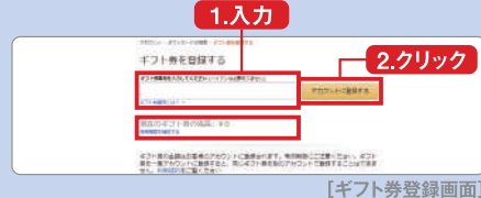
[ギフト券登録画面]

「ギフト券番号を入力してください(ハイフンは必要ありません)」と書かれた登録画面の枠内に、Amazonギフト券番号を入力し「アカウントに登録する」をクリック。