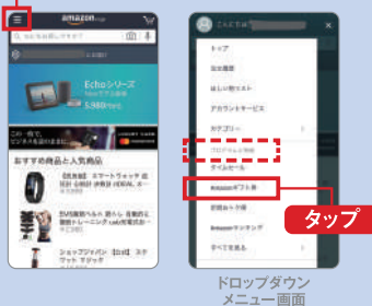
ドロップダウンメニュー画面