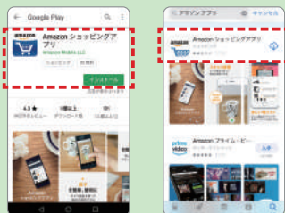
Google Play (Android OS端末向け) 画面 App Store (iOS端末向け) 画面

Google Play (Android OS端末向け) や App Store (iOS端末向け) で「Amazonショッピングアプリ」を検索してインストール。