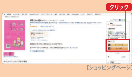
[ショッピングページ]

Amazonサイト内で欲しい商品を見つけたら、数量を選択して「カートに入れる」あるいは「今すぐ買う」をクリック。