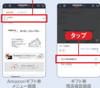
Amazonギフト券メニュー画面