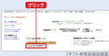
[ギフト券残高確認画面]

ログイン後、「ギフト券の残高」および「Amazonギフト券(チャージタイプ)を購入する」と書かれた行の下にある「Amazonギフト券を登録する」と書かれた枠をクリック。