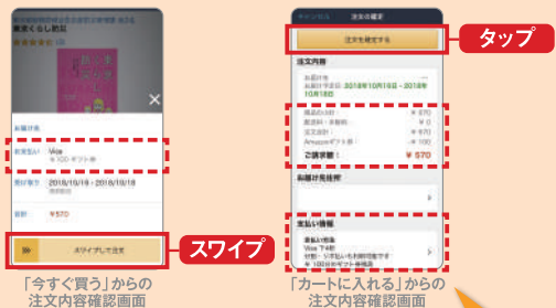
「今すぐ買う」からの注文内容確認画面

注文内容の最終確認画面でギフト券の残高が充たれていることを確認して、「注文を確定する」をタップ、あるいは「スワイプして注文」をスワイプして注文を確定します。