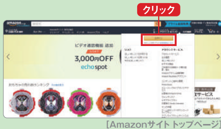
[Amazonサイト トップページ]

パソコンや携帯に「アマゾン」と入力し検索、又は「 http://www.amazon.co.jp/ 」と直接打ち込み、Amazonのサイトを開く。右上の「こんにちは。ログインアカウント&リスト」にカーソルを合わせ「新規登録はこちら」をクリック。